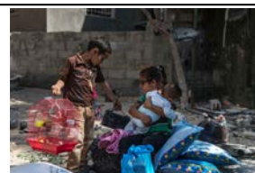
避難の準備をする両親を待つ子ども達

ガザYMCAでは、まずは攻撃下にあるガザ市民への直接的な支援を行うことを最優先します。停戦後は、ガザ市民の心理的な回復を中心に、復興に向けた取り組みを支援します。YMCAは特に青少年の支援に力を注ぎ、青少年団体として地域での役割を果たしていきます。