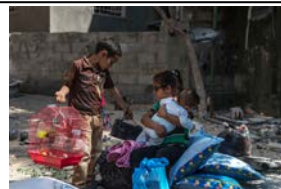
避難の準備をする両親を待つ子ども達

ガザYMCAでは、まずは攻撃下にあるガザ市民への直接的な支援を行うことを最優先します。停戦後は、ガザ市民の心理的な回復を中心に、復興に向けた取り組みを支援します。YMCAは特に青少年の支援に力を注ぎ、青少年団体として地域での役割を果たしていきます。