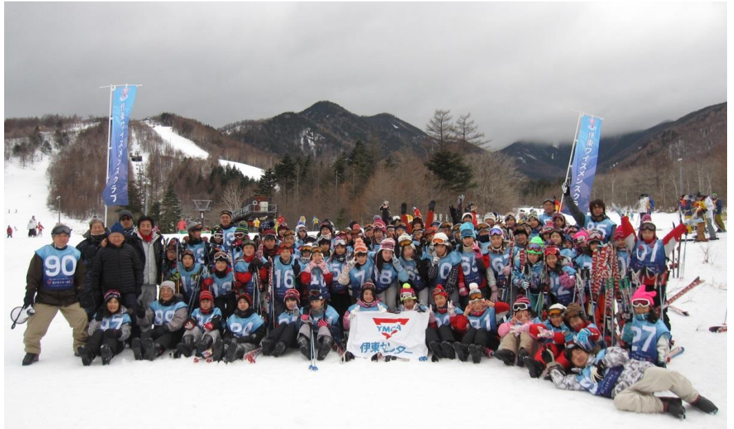
YMCA スキー教室 サンメドウズ清里スキー場にて