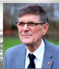
国際会長 ジェイコブ・クリステンセン