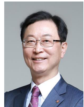
次期国際会長 キム・サンチェ 韓国 ギムヘセブンクラブ 60歳 妻:リー・ミュンヒュー 子ども:4人