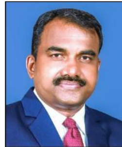
国際書記長 ジョース・ヴァルギース