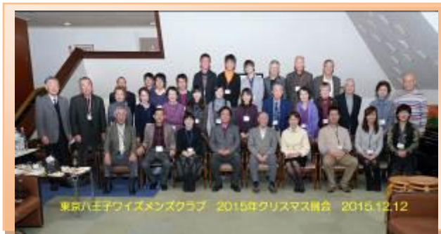
東京ハ王子ワイズメンズクラブ 2015年クリスマス例会 2015.12.12