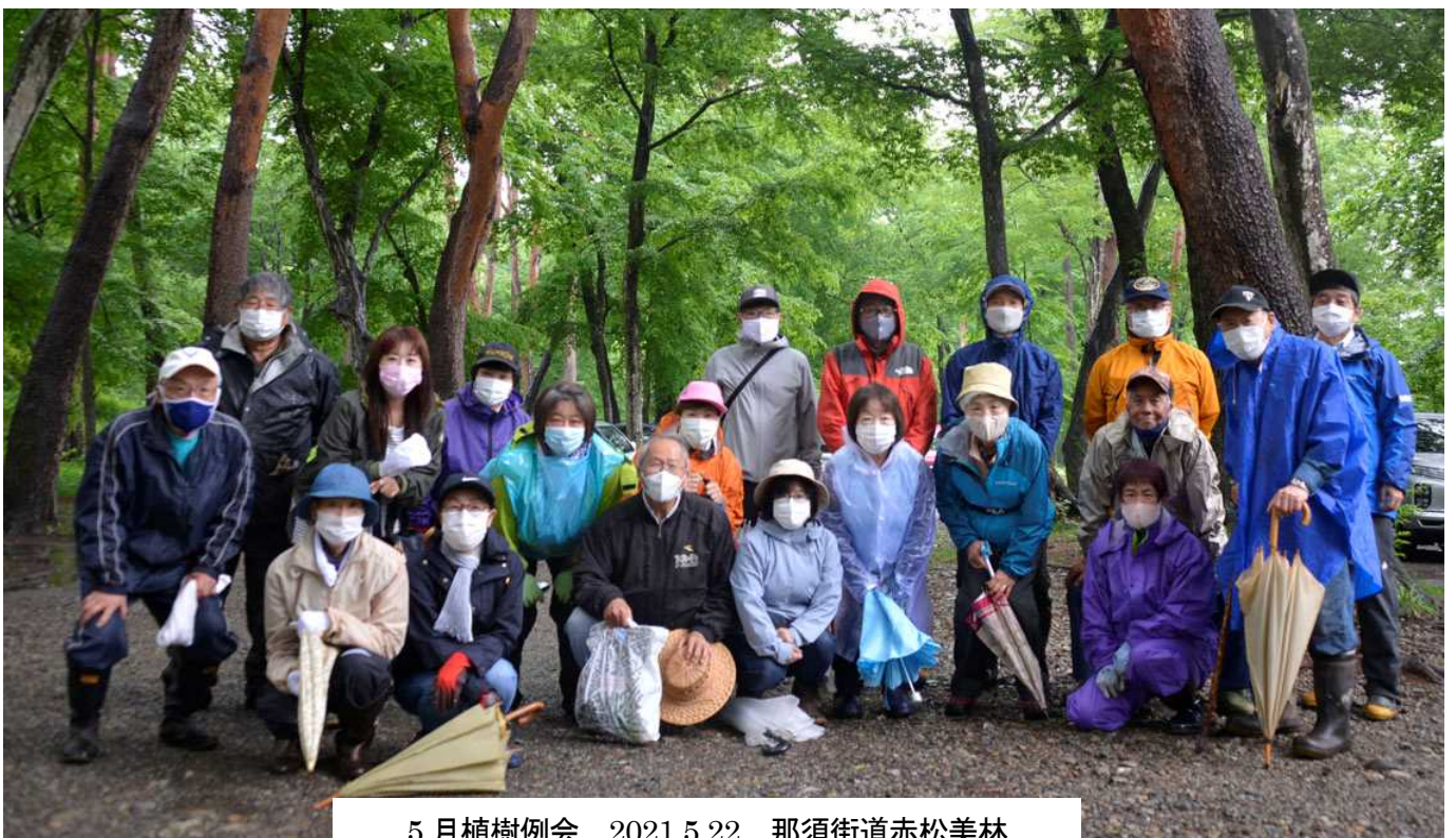
5月植樹例会 2021.5.22 那須街道赤松美林

東京の古河庭園には、毎年鑑賞に行った。昨年と今年は残念ながら叶わない。大正ロマンの建物と合致している。そのようにはいかなくても、自宅で友人とバラを眺めながら、紅茶を頂いているときは、贅沢な時間である。2020年~2021年の最後の期であることを頭の隅に置き、コロナ禍を忘れられるひとときでもある。子育ての終わった今、手をかければかけるだけ応えてくれるバラ作りは、秋にも澄んだ美しい花を咲かせたいと思っている。満開の過ぎた花でポプリにし、エッセンシャルオイルを含めて香りを楽しんでいる。