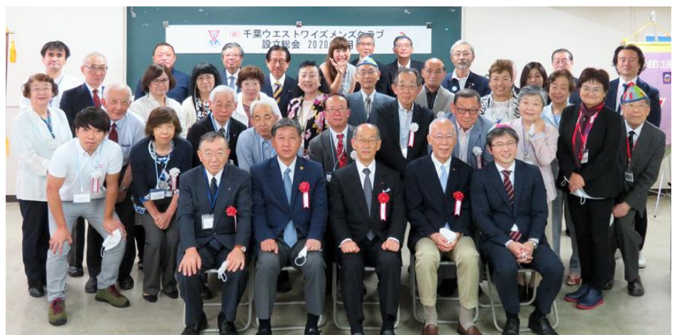
【設立総会出席者全員での集合写真】