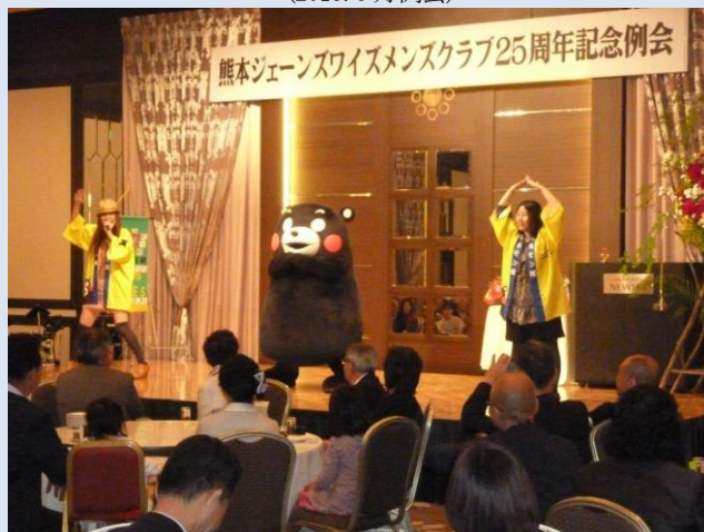
25周年記念例会にはくまモンもお祝いに来場 (2012.5月記念例会)