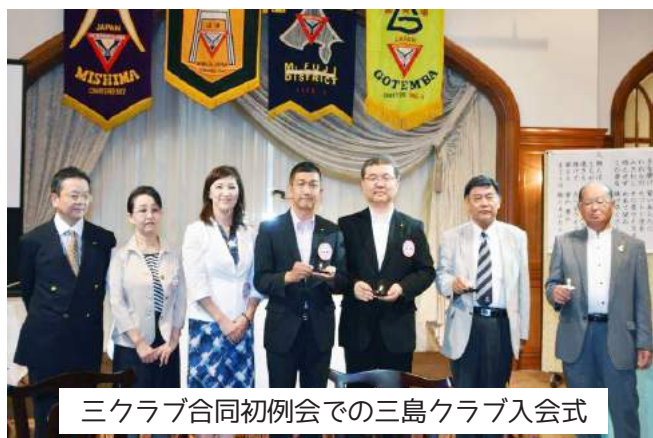
三クラブ合同初例会での三島クラブ入会式

まだ、今期が始まったばかりではありますが、三島クラブのメンバーと力を合わせて、楽しく1年間を過ごして行きたいと思えます。