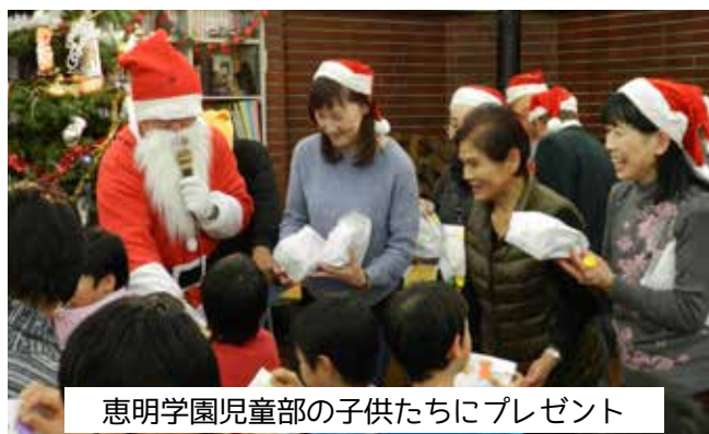
恵明学園児童部の子供たちにプレゼント