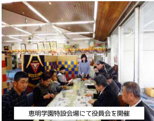
恵明学園特設会場にて役員会を開催