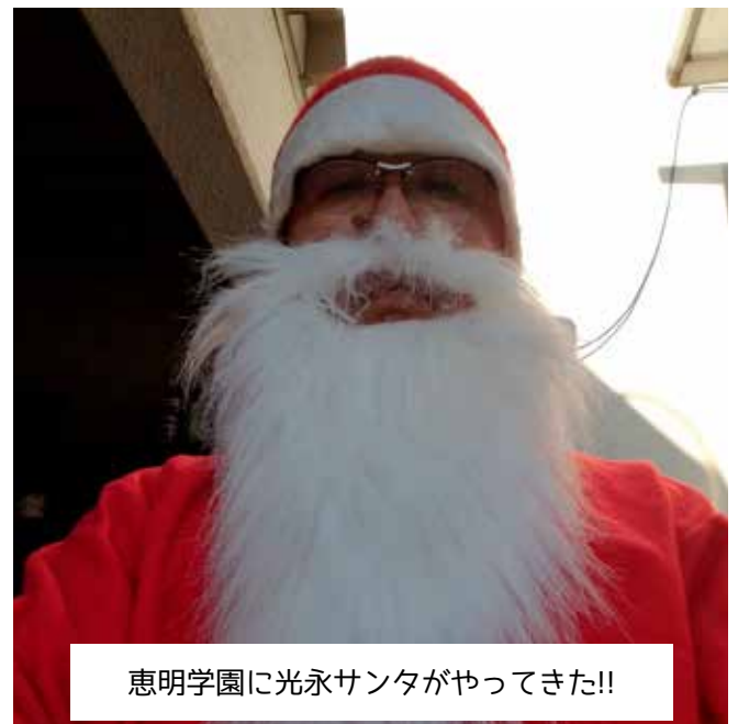
恵明学園に光永サンタがやってきた!!