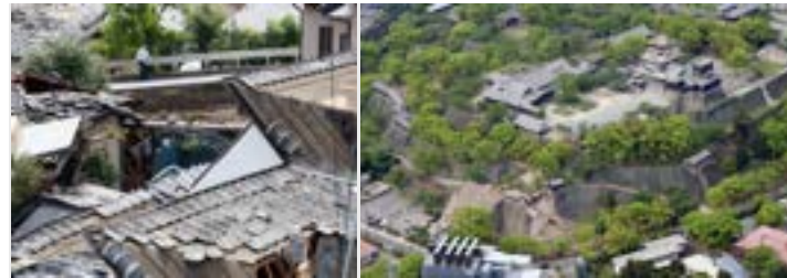
熊本地震・エクアドル地震 今、私たちにできることは？