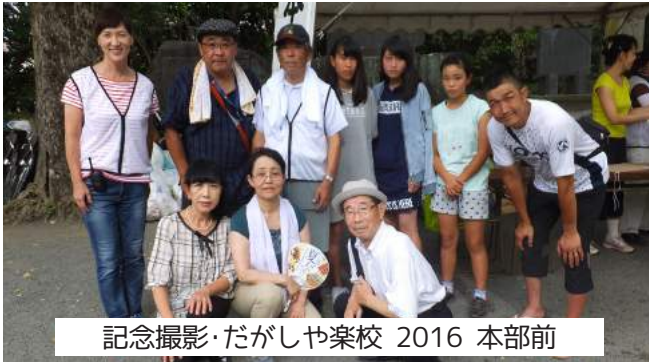
記念撮影・だがしや楽校 2016 本部前