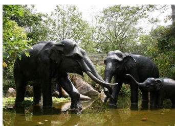
一度は行きたいナイトサファリの動物たちとの出会い