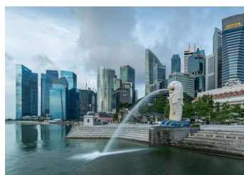
シンガポールには、マーライオンは何頭いる?