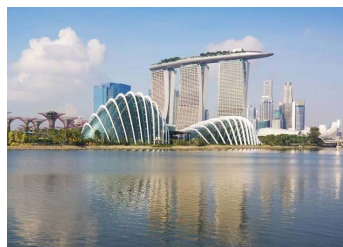
ガーデンズ・バイザ・ベイ(マリーナベイサンズ)