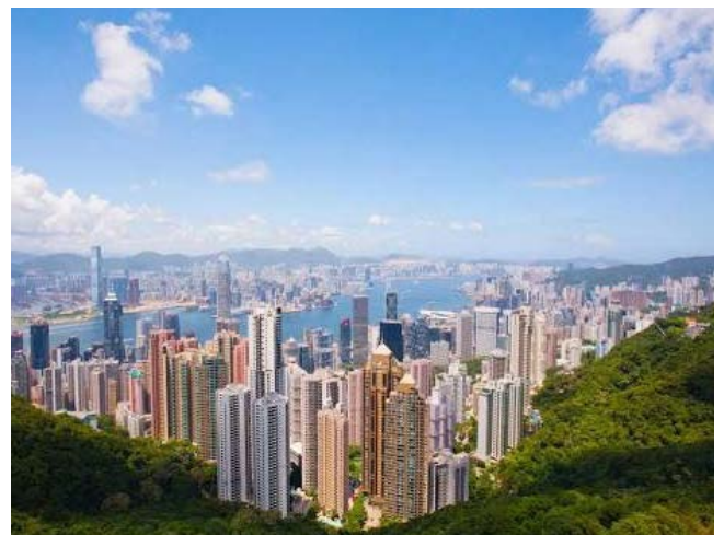
香港のヴィクトリアピークから見た九龍半島