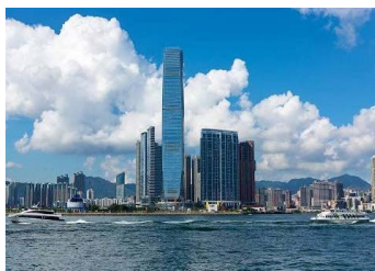
九龍半島側から見た香港島(セントラル側)

最終回は、1988年に訪れた今はない国「東ドイツ編」をお届けします。翌年に、ベルリンの壁が崩壊し、私に長男が誕生しました。お楽しみに。