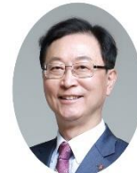
国際会長 キム・サンチェ