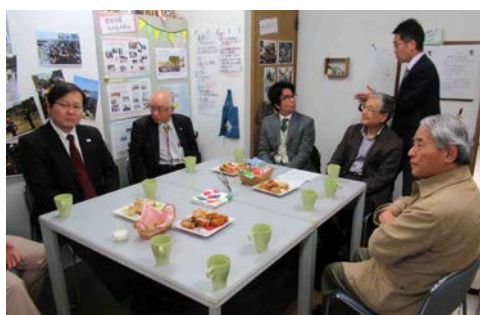
埼玉YMCA早天祈祷会 2018年4月2日 (月) 7am