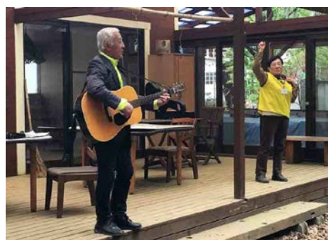
2018年4月14日 (土) 埼玉3クラブ (所沢・川越・埼玉) 合同ウォーク