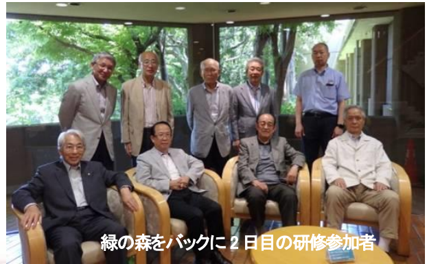
緑の森をバックに2日目の研修参加者