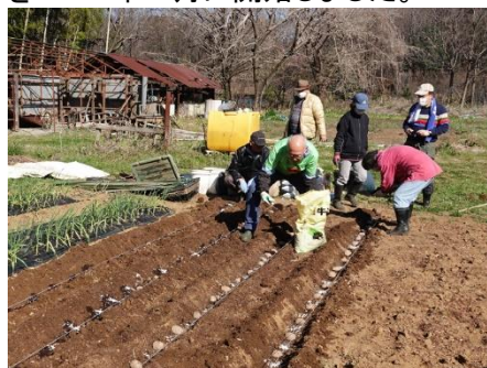
ジャガイモの植え付け

私たちのクラブは、2016年にチャーターされましたが、CS活動のひとつとして、新しいメンバーを惹きつける手段として、そしてまた、クラブメンバーが共に働くことによってクラブの結束を固めるため、クラブの農園を2017年8月に開始しました。