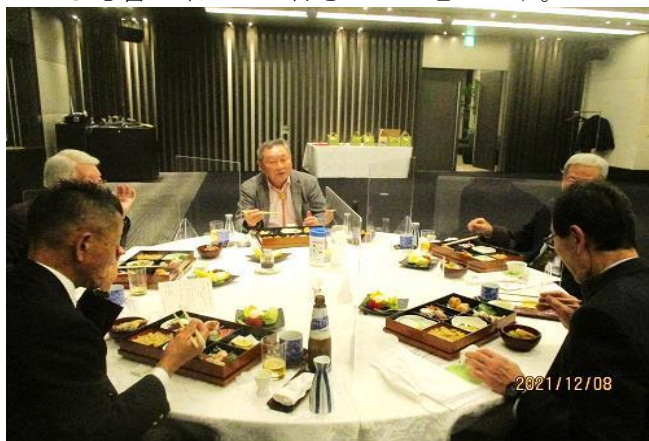
久しぶりのアルコールが入った会食に会話も弾みます

12月例会の時、例年のクリスマス会の2年続けての中止でしたので、親睦会が開かれ皆の連帯感に何か訴えなければと思ひ。飲みながらのマイタイムを行い、発言の後に少しのお土産を用意させて頂きました。やはりこの2年間コロナで大変な思いで過ごして来た思いも有って、意見の中にもいい加減に収束してくれとの思いが凝縮されていました。最近富士市ではクラスターが発生して、東京都全体よりも感染者数が多かったです。その理由は地元の小学校に発生してしまったからでした、やはりちょっとした油断が大変な感染を引き起こしてしまう事に成りました。私達会員も高齢者でワクチンも二回接種して有る人も多く安心とは思いますが、新しくオミクロン株に様な新種も現れたことですので。これからも一人の感染者も出さない様に、対策を徹底して会員の親睦にも目を配り。楽しいワイズライフをこれからも皆で楽しんで行きたいと思ひます。