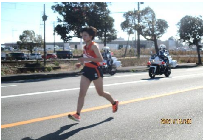
4区を疾走する選手

年末恒例の「全日本大学女子選抜駅伝競走（富士山女子駅伝）」が12月30日、快晴の駅伝日和の中、富士山も素晴らしい冬景色で選手のみなさんを歓迎して富士宮市と富士市の7区間43.4キロで24チームが参加し、開催されました。今年で9回目のこの大会に1回目からボランティアで富士クラブも参加しています。昨年、今年とコロナ禍でボランティア協力者の年齢が制限され70歳以下となり高齢化が進む我がクラブは参加者も少なくなりました。しかし寒い中、自分の為、チームの為に懸命に襷をつなぐ選手のみなさんに「頑張れ！」とエールを送りながらコースボランティアに参加していただきましたメンバーの皆さま、お疲れ様でした。ありがとうございました。