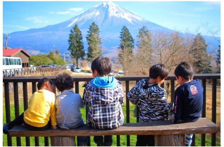
朝霧高原は冬到来ですが子供たちは元気です