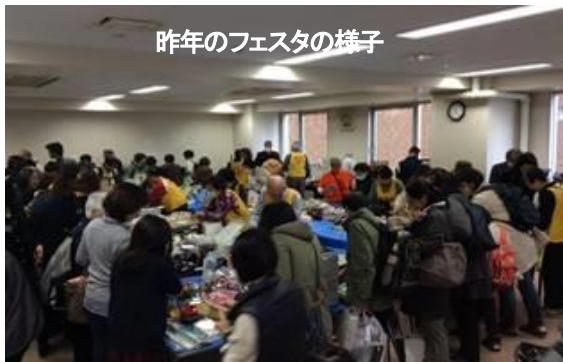
昨年のフェスタの様子

今年も、11月23日に「ウェルカムフェスタ」を予定しています。フェスタは「国際・地域協力募金」のために行われる活動です。収益はすべ