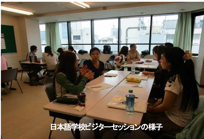
日本語学校ビジターセッションの様子

日本語学科の学生が、日本で生活する中で感じられた日本の社会に対する感想や意見を知ること、学生の方々の置かれている状況や考え方を、身近な例から理解することができた。中国、台湾、インドネシア、フィリピン、ベトナムなど